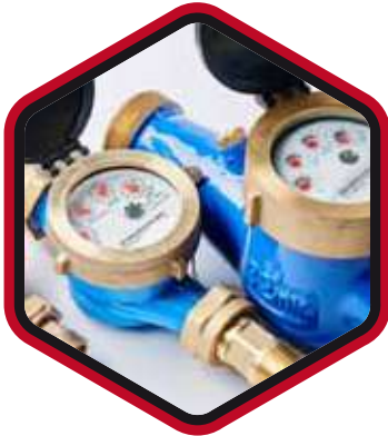
MEDIDORES DE AGUA