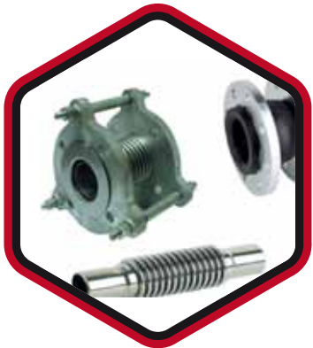
JUNTAS DE EXPANSIÓN